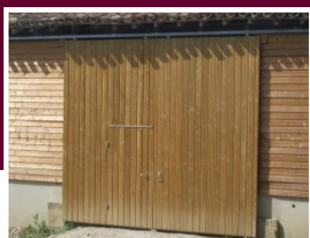
Portail double avec portillon