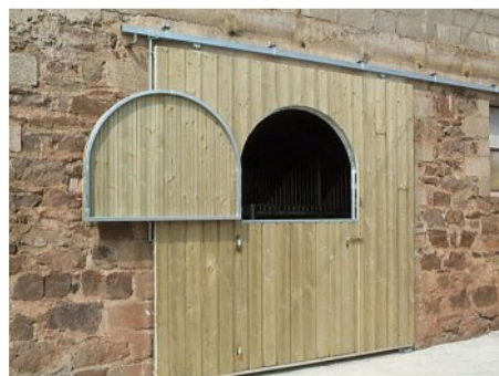
Portail avec porte centrale double battant, ouverture haut demi-lune