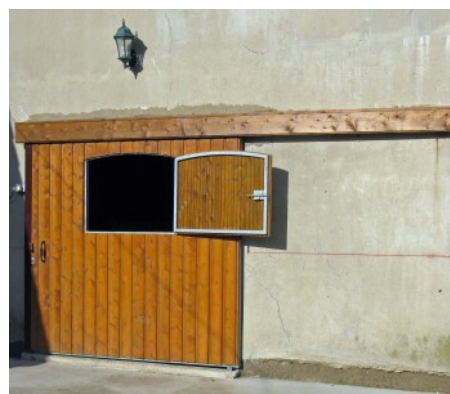
Portail avec fenêtre centrale